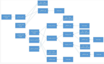
چارت تحصیلی (جهت نمایش کامل، بر روی عکس کلیک نمایید)